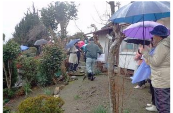
込堂停留所跡で説明を聞いています