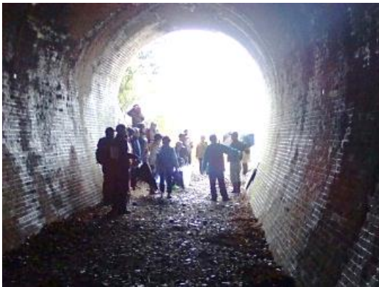
中山トンネル さあ出発

あいにくの雨で、当初39名の参加予定者が21名となりましたが、参加された方々は要所要所で説明を受けながら、SL機関車が通っていた頃に想いを馳せているようでした。