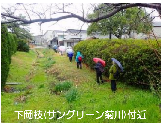
下岡枝(サングリーン菊川)付近