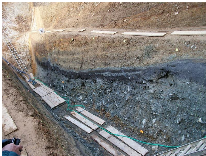
菊川断層 足場板付近が破碎帯